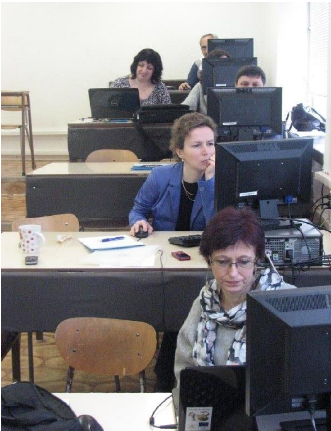
Učitelia 2. Skupiny – 2.4.2012