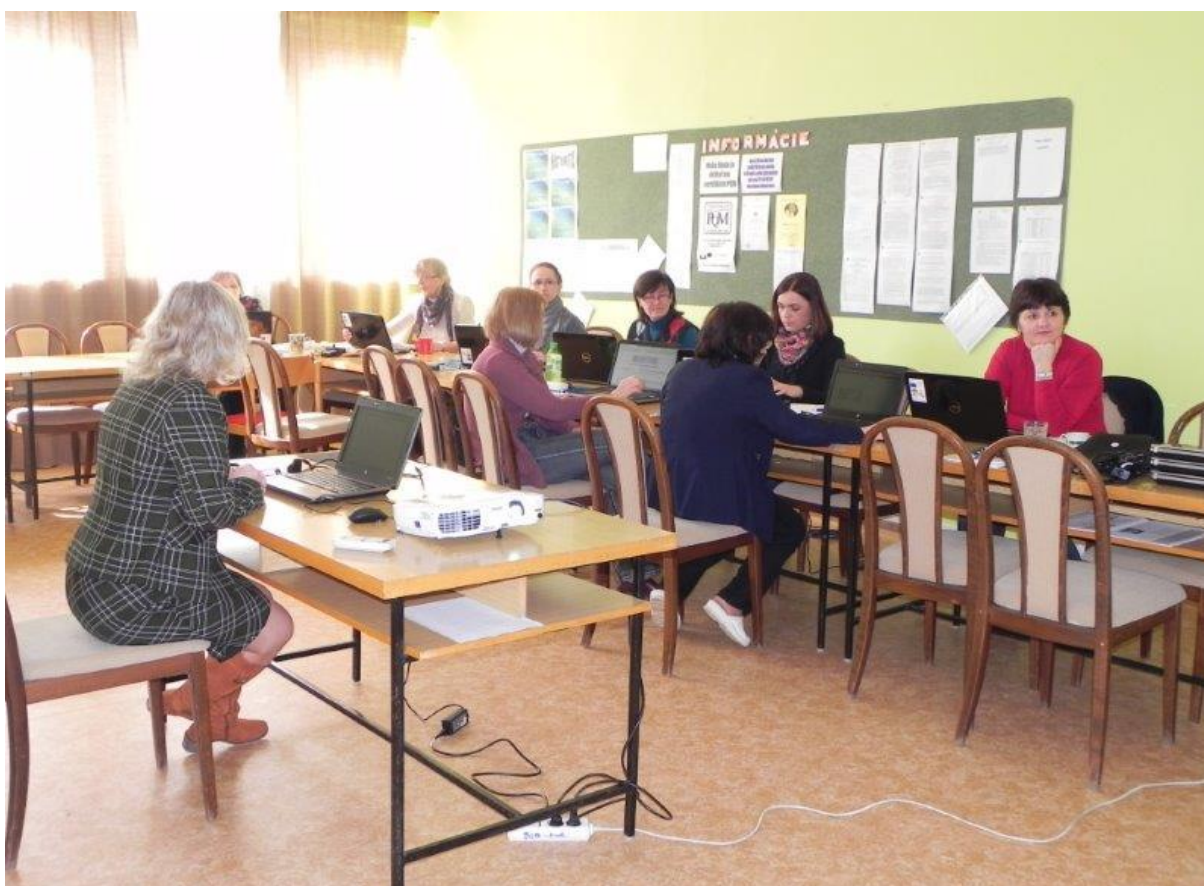
Tvorba interaktívnych testov – 2.4.2013