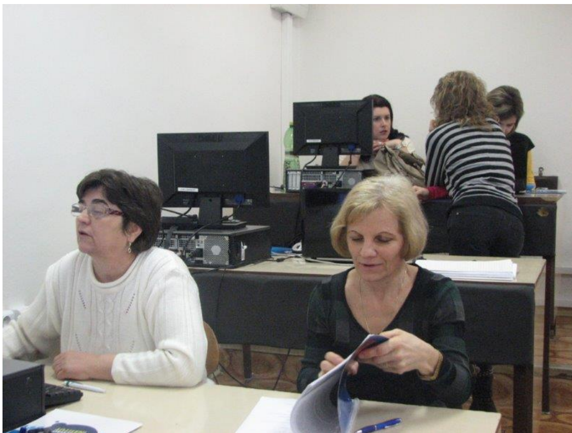
Spracovanie obrázkov - 2.4.2013