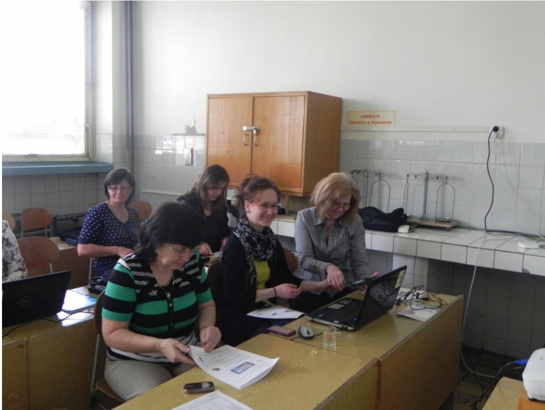
Využitie modulárneho systému Vernier v biochemikom laboratóriu - 24.4.2013